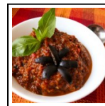
tavola il "Pesto di pomodori secchi"

aprile 19, 2016 Dalla Sicilia un condimento saporito: serviamo in