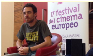
Elio Germano a Lecce per L'Ulivo d'Oro

Elio Germano è a Lecce, per incontrare il pubblico e per ritirare l'Ulivo d'Oro alla Carriera, malgrado i suoi 35 anni.