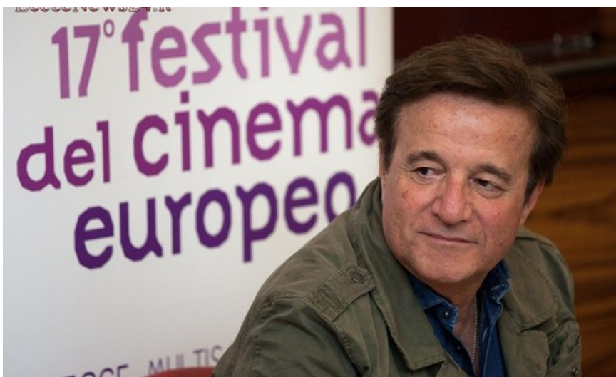
Christian De Sica a Lecce

Christian De Sica, tra i protagonisti indiscussi del cinema italiano, presente stamattina a Lecce - presso l'Hotel Risorgimento - in occasione della penultima giornata del Festival del Cinema Europeo.