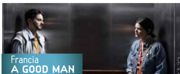
Francia A GOOD MAN