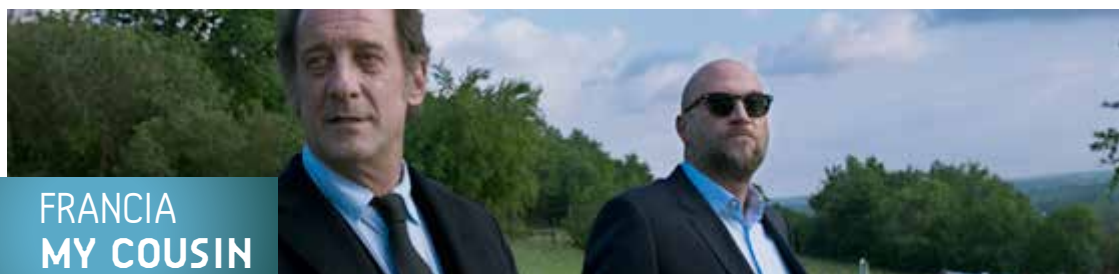
FRANCIA MY COUSIN