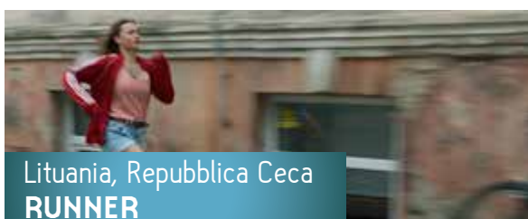
Lituania, Repubblica Ceca RUNNER