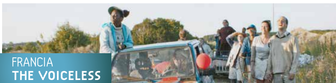
FRANCIA THE VOICELESS