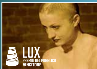
COLLECTIVE di ALEXANDER NANAU