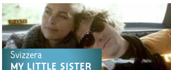
Svizzera MY LITTLE SISTER