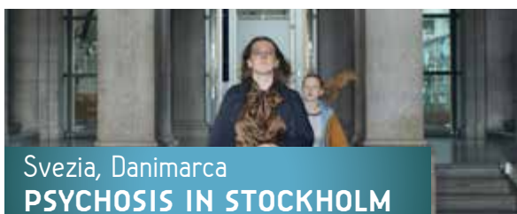
Svezia, Danimarca PSYCHOSIS IN STOCKHOLM