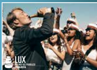
UN ALTRO GIRO di THOMAS VINTERBERG