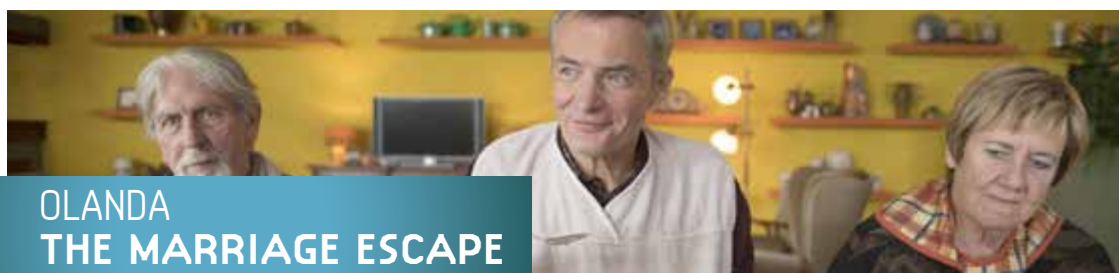
OLANDA THE MARRIAGE ESCAPE