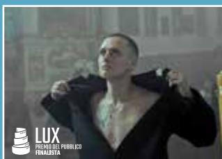
CORPUS CHRISTI di JAN KOMASA