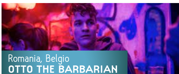
Romania, Belgio OTTO THE BARBARIAN