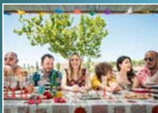
I PREDATORI di PIETRO CASTELLITTO