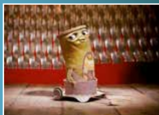
TRASH di FRANCESCO DAFANO e LUCA DELLA GROTTA